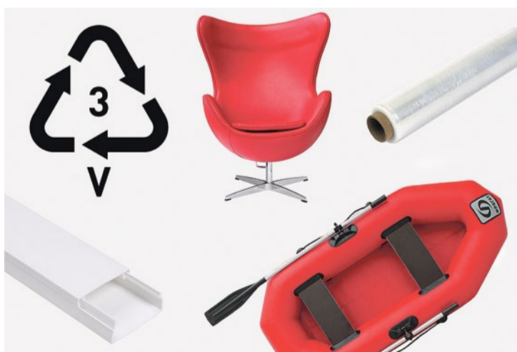
Виды пластика: код маркировки поливинилхлорида (ПВХ)

18 июля – «Экопраздник» Место и время уточняются, следите за анонсами в группе ВКонтакте vk.com/spbmo72 или звоните по телефону 360-39-22.