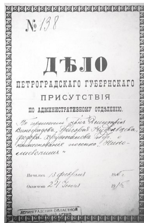
Титульный лист архивного дела (ЦГИА СПб. Ф. 258. Оп. 3. Д. 138.)