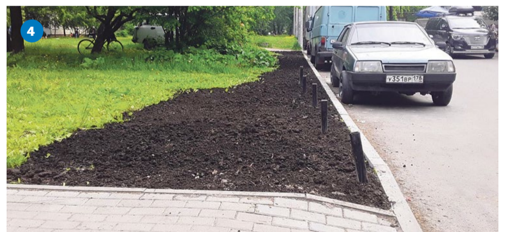
4 Восстановление газона на улице Турку, 22/6