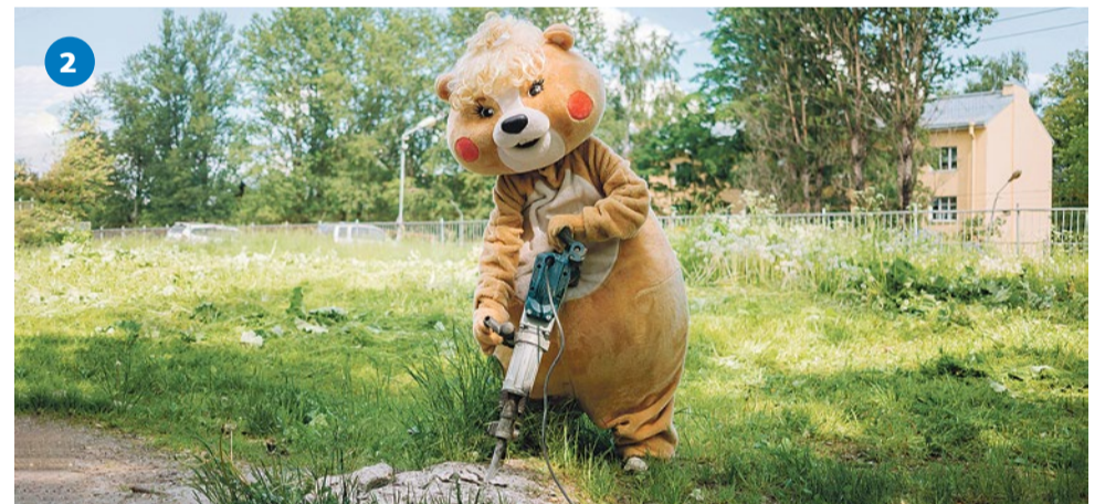
2 Вывоз железобетонных блоков, Софийская улица, 32/4