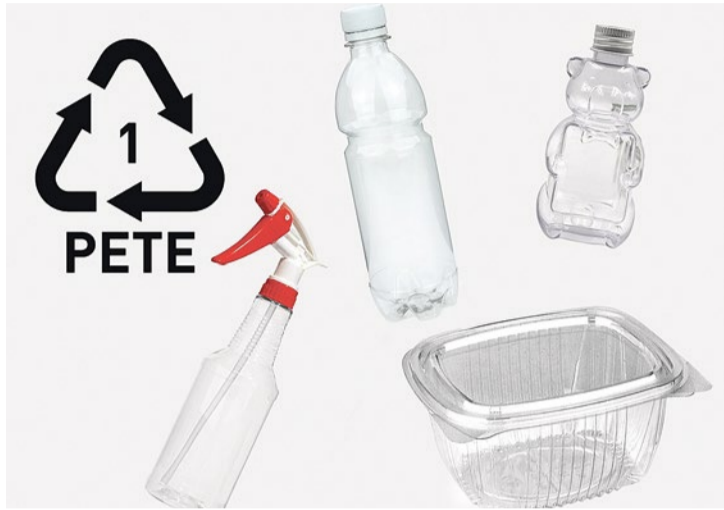
Виды пластика: код маркировки полиэтилентерефталата – бутылочный ПЭТ и небутылочный ПЭТ

В прошлом выпуске мы с вами узнали, что экологичный образ жизни означает производить меньше отходов. Но что делать в тех случаях, когда купить товар без упаковки не представляется возможным? Нужно отправить упаковку на переработку!