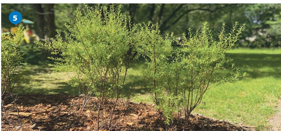
5 Высадка кустов спиреи серой, Бухарестская улица, 94/6