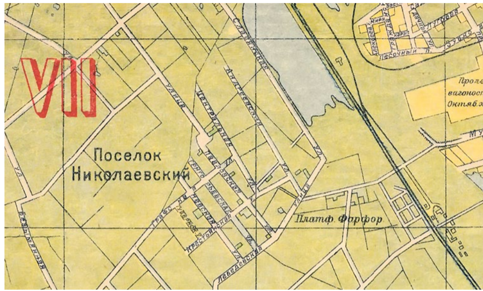
Фрагмент карты Ленинграда, 1933 год

в 1909 году крестьянам села Смоленского, что располагалось на левом берегу Невы, приблизительно в границах нынешнего Большого Смоленского проспекта (название не случайно) и улицы Крупской, была выделена территория в 70 десятин земли на 255 участков восточнее станции Фарфоровский пост Николаевской железной дороги.