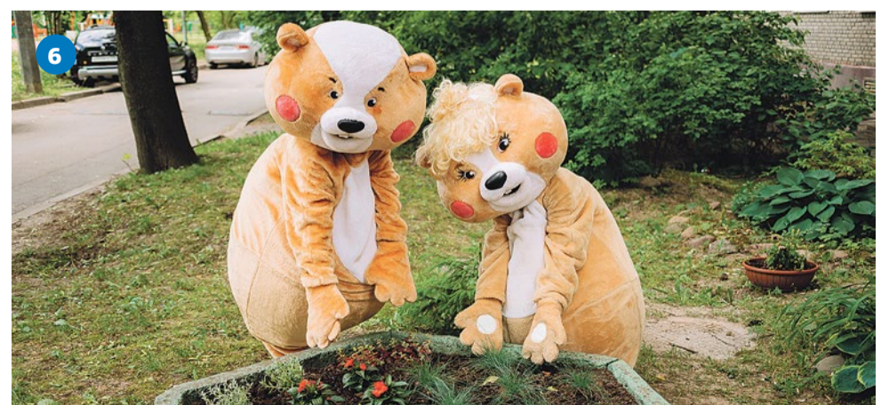
6 Высадка овсяницы, розмарина, бальзамина и полыни в вазоны на улице Белы Куна, 7/1