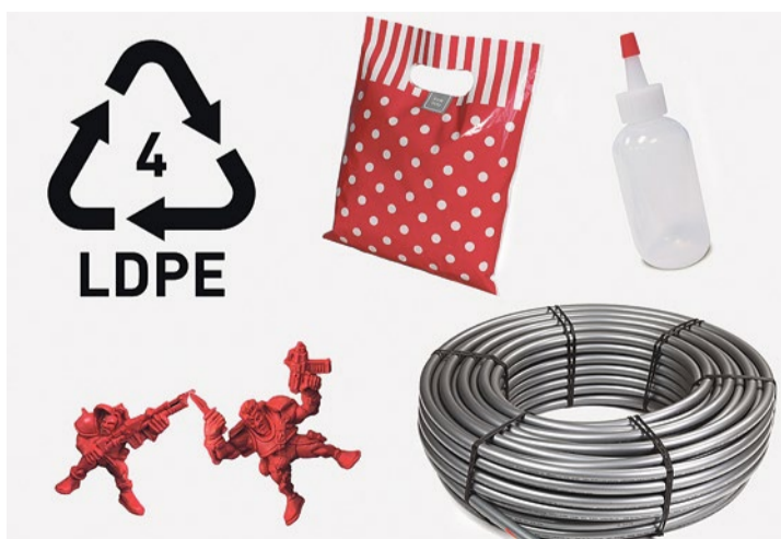
Виды пластика: код маркировки полиэтилена высокого давления (ПВД)