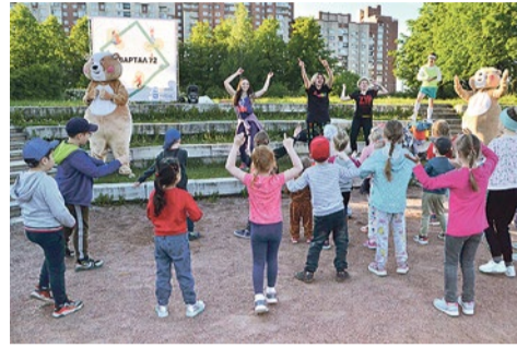
1 июня – праздничное открытие летних физкультурных занятий в парке Интернационалистов

О повестить жителей было решено на площадке в парке Интернационалистов. С собой взяли двух хомяков: они раздавали листовки с расписанием занятий, охотно фотографировались, и у Купчино-арены собралось много взрослых и ребятишек.