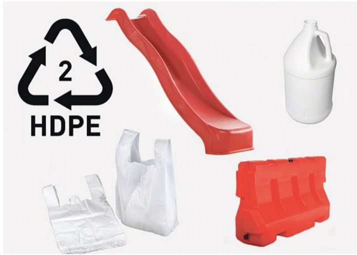
Виды пластика: код маркировки полиэтилена низкого давления – твердый ПНД и мягкий ПНД

Для того, чтобы не было мучительно больно нести отобранное вторсырье на помойку, а не в контейнер на переработку, надо определить, какие виды сырья вы сможете сдавать и куда. Найти пункты приема можно на карте recyclemap.ru/spb , а понять, к какому виду вторсырья относится конкретный предмет, поможет маркировка. Какие виды маркировок бывают и что они обозначают? Давайте разбираться.