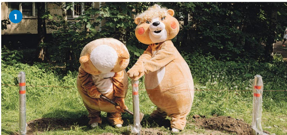
1 Установка антипарковочных столбиков на улице Турку, 22/5

21 июня состоялся электронный аукцион на вторую очередь благоустройства. До 20 октября на улице Пражской, 25 и проспекте Славы, 46/2 отремонтируют пешеходные дорожки и установят скамейки. За домом 41/1 по Софийской улице заменят асфальт, на Бухарестской, 86/1 – построят и отремонтируют пешеходные дорожки и построят новую детскую площадку.