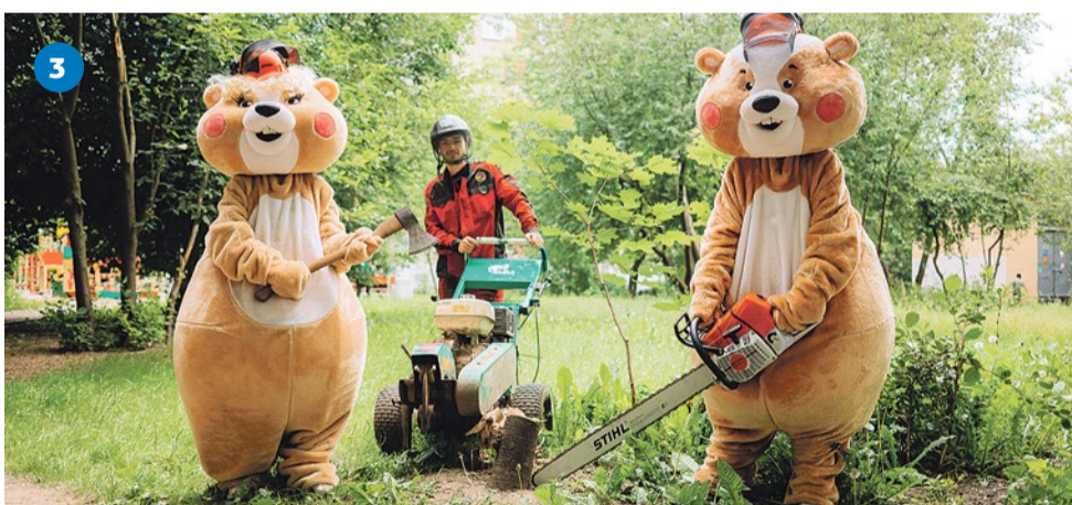
3 Фрезеровка пней на улице Белы Куна, 7/1